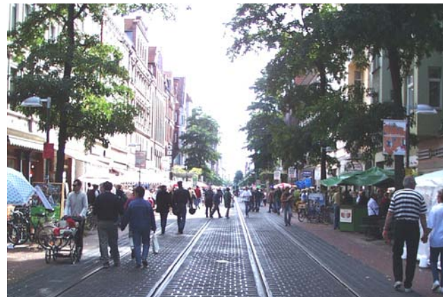
Start und Ziel: Limmerstraße

12:00 Schnupperlauf längs der Limmerstraße, ca. 580 m, bis 12 Jahre 13:00 Volkslauf ca. 6,8 km + 10 km + (Nordic) Walking ca. 6,8 km