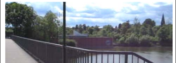
Die Laufstrecke führt über das Wehr in Limmer