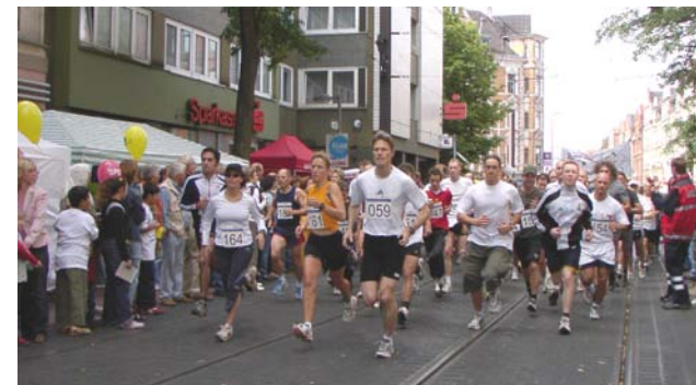
Start beim 1. Volkslauf Linden-Limmer 2005