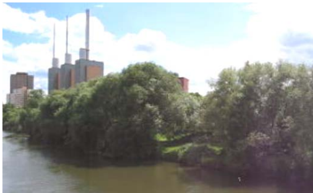
Laufstrecke im Grünen in Linden-Nord an der Ihme

Das Marktfest Limmerstraße fällt 2018 aus.