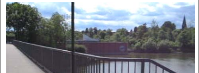
Die Laufstrecke führt über das Wehr in Limmer