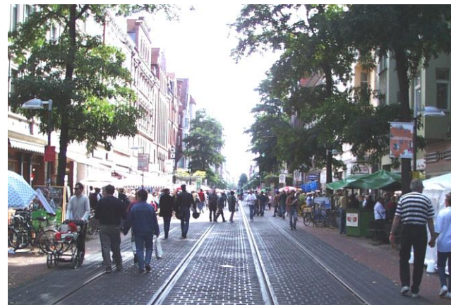
Start und Ziel: Marktfest Limmerstraße

12:00 Schnupperlauf längs der Limmerstraße, ca. 580 m, bis 12 Jahre