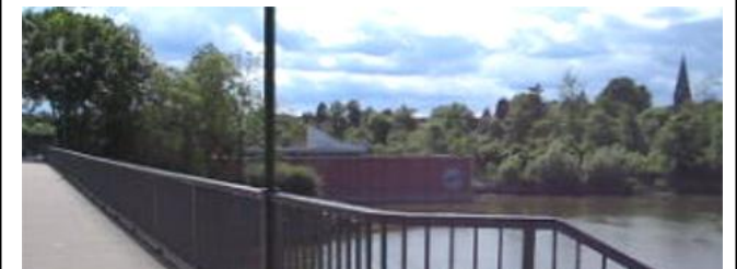
Die Laufstrecke führt über das Wehr in Limmer