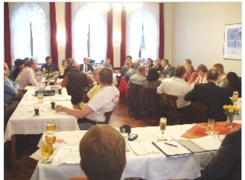
mehr: www.lebendigesLinden.de und www.halloLindenLimmer.de

Nächster Termin: 28.11.2007, 14. Wirtschaftsforum Lebendiges Linden e.V.