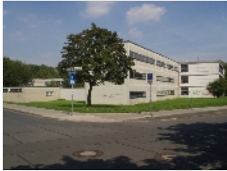
Haupt- und Realschule Fössefeld, Limmer