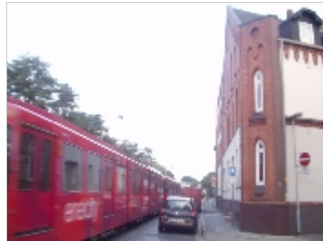
Wunstorfer Straße mit Fußwegverengung und Straßenbahn

wegraumes ersetzt durch Parkbuchten, um die der Fahrradweg herumgeführt wird.