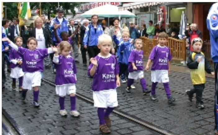
Schützenausmarsch: Der F-Jugend von SV 07 Linden machte der Umzug eine Menge Spaß.

Mehr bei: www.halloLindenLimmer.de , dort gibt es viele weitere Fotos zu den 3 Festen und auch eine Auflistung der zahlreichen Unterstützer des Volkslaufes.