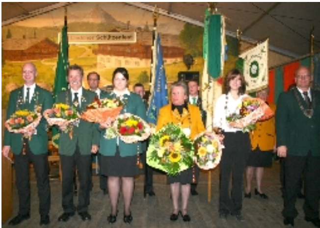
Im beinahe rauchfreien Festzelt: Die Königinnen und Könige lassen sich feiern

Der Bieranstich erfolgte ohne prominente Hilfe - im Vorfeld der Wahlen politisch neutral - durch einen Mitarbeiter der Gilde-Brauerei.