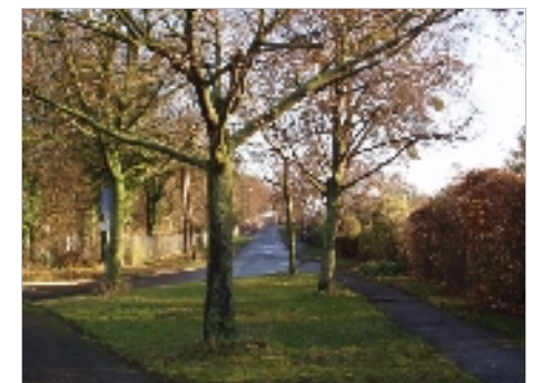
bergauf von der Badenstedter Straße aus

Text: Helmut Zimmermann Die Straßennamen der Landeshauptstadt Hannover, Verlag Hahnsche Buchhandlung ISBN 3-7752-6120-6