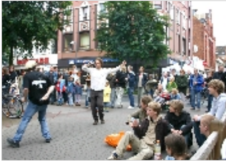
Die Bühne Limmerstraße: Livemusik erwies sich als Publikumsmagnet