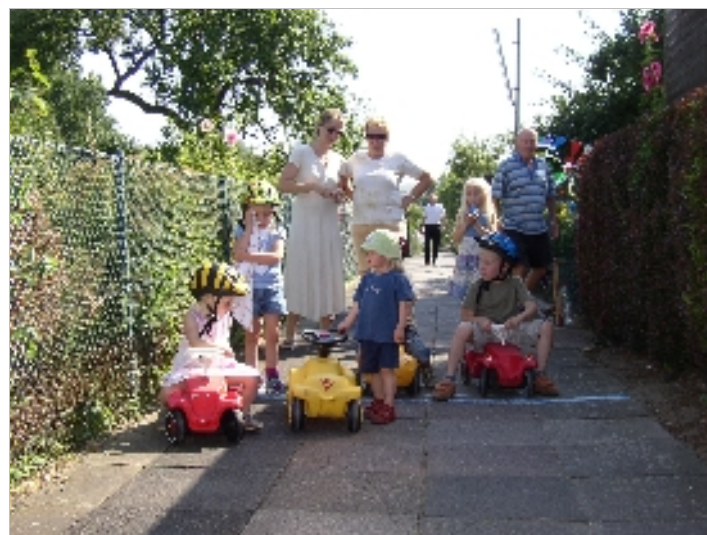
Formel Bobby im Fahrerlager: Die Rennrutscher in der Kategorie bis 7 Jahre. Foto/Text: esch