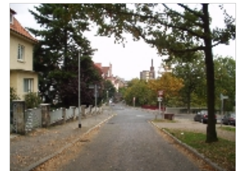
bergab zur St. Martinkirche und zur IGS Linden

Am Lindener Berge: Linden-Mitte, Linden-Süd, südlich der Badenstedter Straße; alter Weg von Linden zum Steinbruch und zur Windmühle auf dem Lindener Berg, um 1820 „Am Steinberge“, 1839 „Lindener Berg“, 1858 „(Lindener) Bergstraße“, 1909 umbenannt „Am Lindener Berge“, weil die Straße über den Lindener Berg führt.