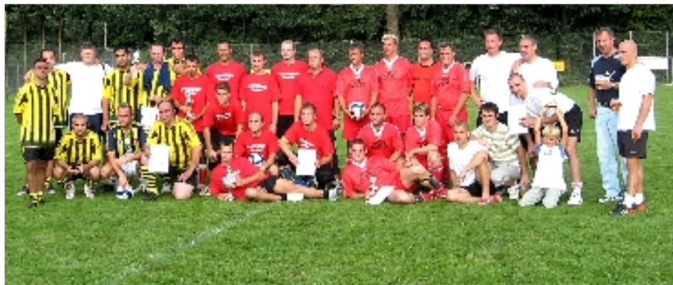
Platz 1: Rabimmel VWN, Platz 2: Montage Power, Platz 3: Torpedo ML6

33 Betriebsmannschaften aus den Montagen kickten am 25.08.2007 ab 9:30 Uhr bei schönstem Sonnenschein erstmals um den Wanderpokal des VW-Werkes Stöcken.