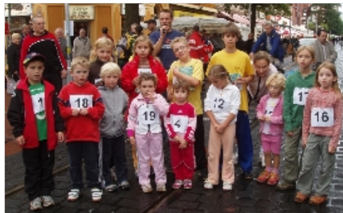
Volkslauf Linden-Limmer: Ganz erstaunt über den Applaus - die "Schnuppis" nach dem Zieleinlauf