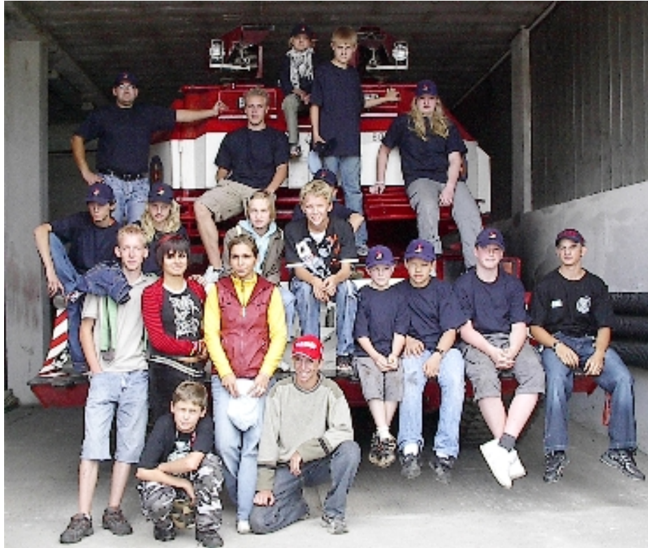
Jugendfeuerwehr Zohor und Jugendfeuerwehr Limmer