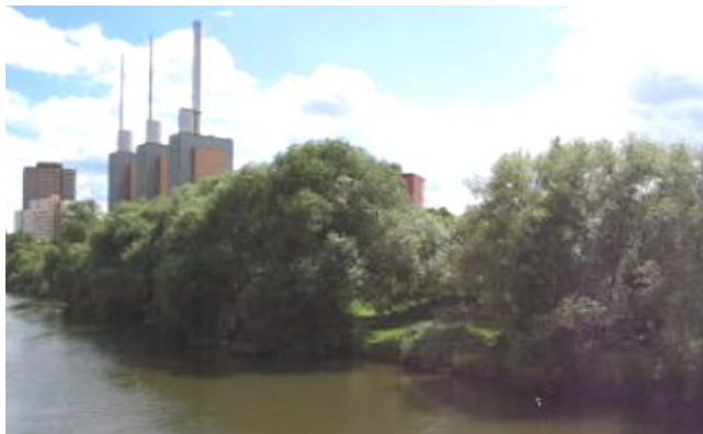
Laufstrecke im Grünen in Linden-Nord an der Ihme