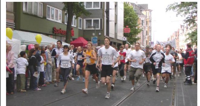
Start beim Volkslauf Linden-Limmer 2005

Diese Veranstaltung ist Teil der Aktion „Laufpass der Region Hannover“