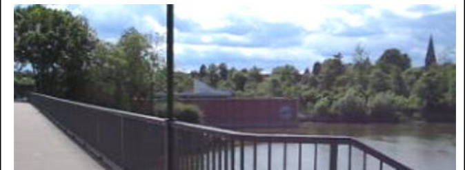
Die Laufstrecke führt über das Wehr in Limmer