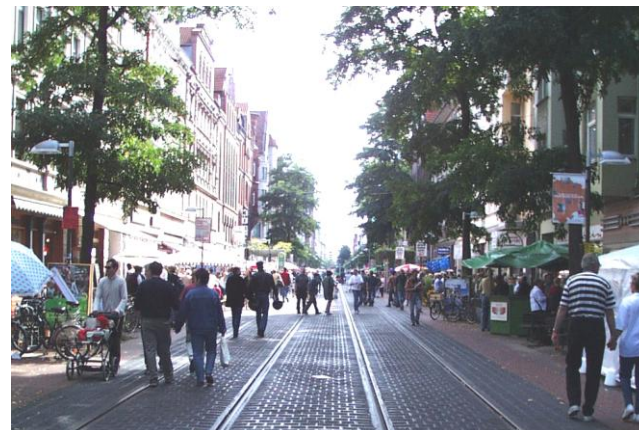
Start und Ziel: Marktfest Limmerstraße

12:00 Schnupperlauf längs der Limmerstraße, ca. 580 m, bis 12 Jahre